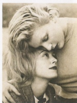
Man Ray (Emmanuel Rackidy, 010, Nusch au miroir, 1930, Musée d'Art et d'Histoire de Saint-Denis

Ci-dessus et ci-contre, documents Musée d'Art et d'Histoire de Saint-Denis. Ci-dessous, photo de l'une des vitrines, contenant, parmi plusieurs documents, au premier plan, la gravure que réalisa le sculpteur Henri Laurens d'après le poème La Plage de Paul Eluard (manuscrit infra).